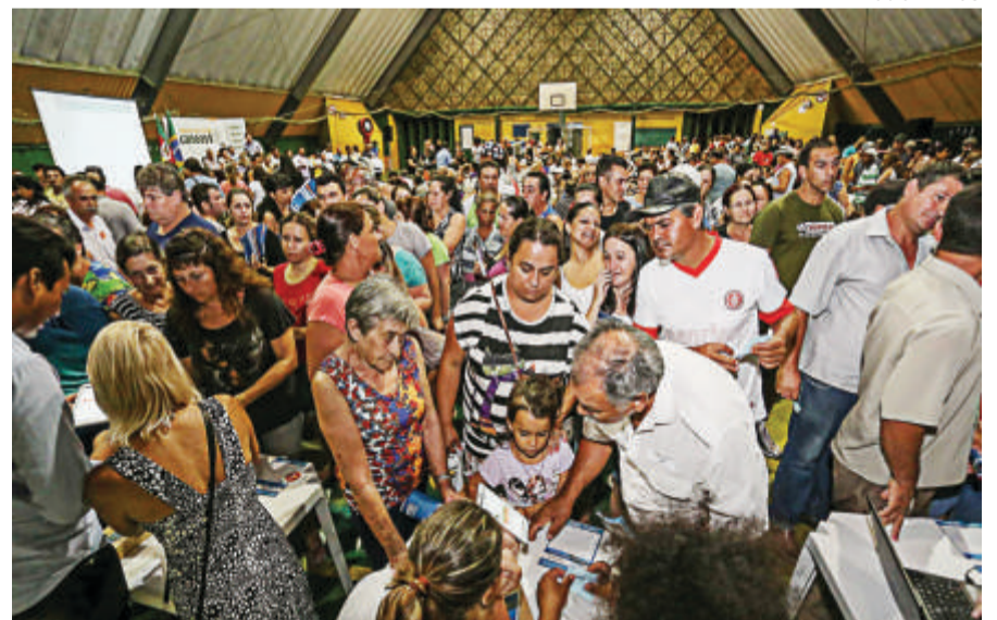
Orçamento Participativo de Canoas tem a maior mobilização no País