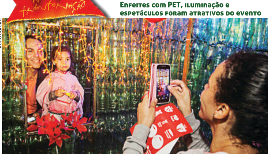
ENFEITES COM PET, ILUMINAÇÃO E ESPETÁCULOS FORAM ATRATIVOS DO EVENTO

Sustentabilidade, conscientização ambiental e inclusão social. Apenas esse tripé já seria suficiente para dimensionar a importância de um projeto como o Natal da Transformação. Que tal acrescentar um quarto olhar? O do ENCANTAMENTO, assim mesmo, em letras garrafais (todas de PET, claro!).