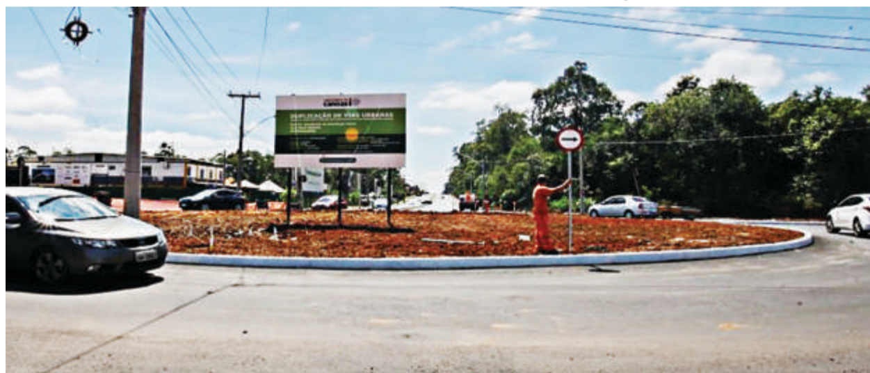
Acesso ao Park Shopping Canoas, no Bairro Marechal Rondon, é uma das 78 obras de pavimentação