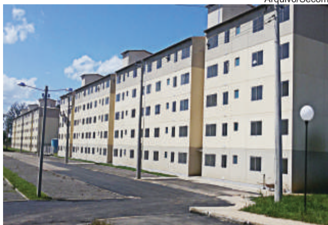
Residencial MQ3C tem 300 apartamentos

As medidas de redução de despesas adotadas pela Administração Municipal no início de 2015, que já resultaram em uma economia de R$ 70 milhões, ajudam a garantir a continuidade dessas obras, fundamentais para manter a qualidade dos serviços prestados aos canoenses.