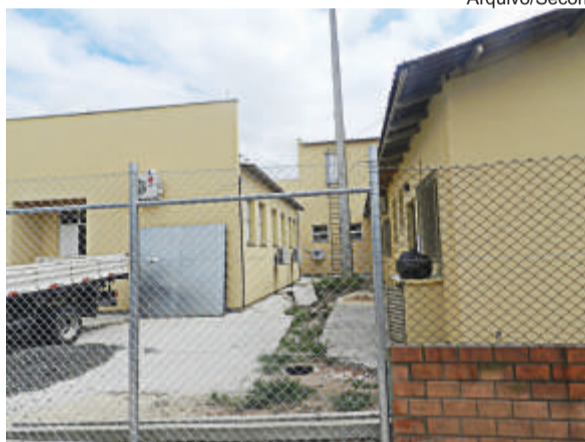
Ampliada UBS Praça América, no Mathias Velho