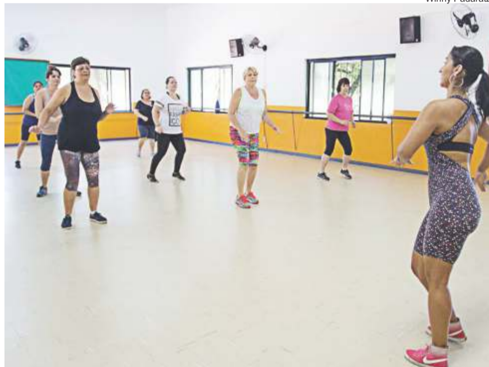
Capão do Corvo: aulas de zumba ajudam a melhorar a saúde e divertem

Canoas se torna melhor quando você participa.