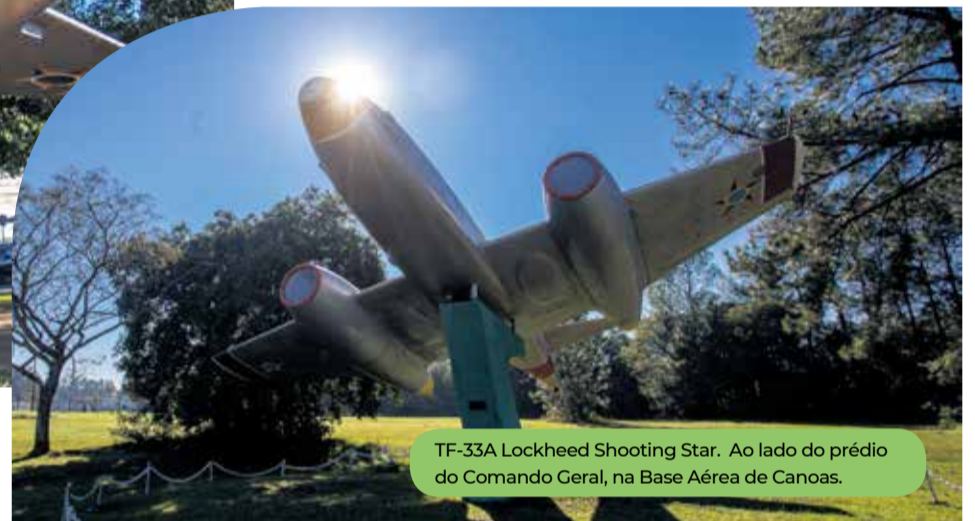
TF-33A Lockheed Shooting Star. Ao lado do prédio do Comando Geral, na Base Aérea de Canoas.

No mês de aniversário de 82 anos, o Projeto de Lei Estadual nº 35/2021, que reconhece Canoas como a Cidade do Avião, foi aprovado por unanimidade. No último dia 15, a aprovação ocorreu em reunião ordinária realizada pela Comissão de Assuntos Municipais da Assembleia Legislativa do Rio Grande do Sul. A partir de agora, o projeto aguarda a sanção do Governo do Estado.