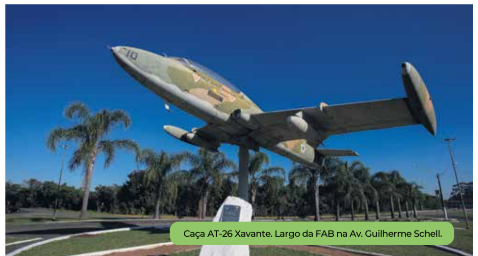
Caça AT-26 Xavante. Largo da FAB na Av. Guilherme Schell.