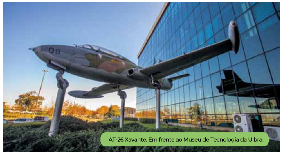
AT-26 Xavante. Em frente ao Museu de Tecnologia da Ulbra.

Quem visitar o Aviãoteca, além de contar com o acervo de livros físicos e digitais, terá a experiência de um simulador de voo.