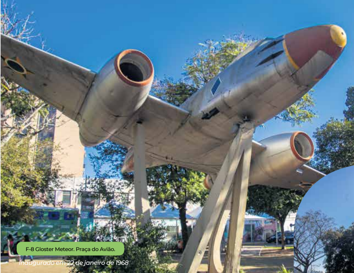
F-8 Gloster Meteor. Praça do Avião.