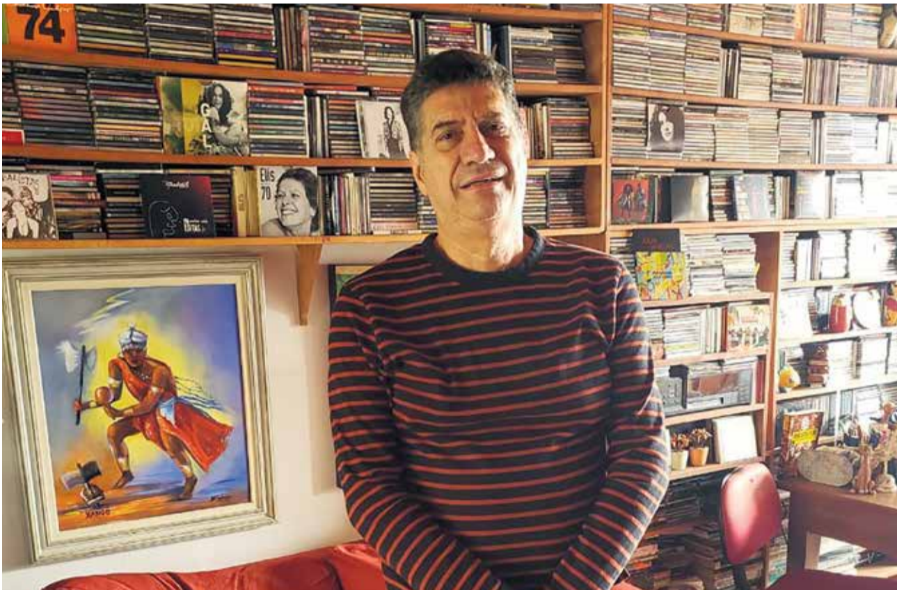
37ª Feira do Livro de Canoas

Alabarse - Não é exagero afirmar que a Feira do Livro é um dos cartões postais da cidade. Nossa Feira é reconhecida como a segunda do Estado, em tamanho e importância. Essa dimensão precisa ser retomada, a de que a Feira deve valorizar o segmento do livro, sem preconceitos, sem bairrismos. Um evento do porte da Feira deve, como missão, romper a bolha e apresentar Canoas ao Brasil e ao mundo. É a velha máxima do Tolstói: falar da sua aldeia para conquistar o mundo. Negar isso é condenar a Feira a não evoluir nem crescer.