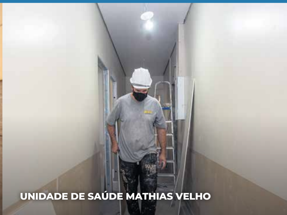
UNIDADE DE SAÚDE MATHIAS VELHO