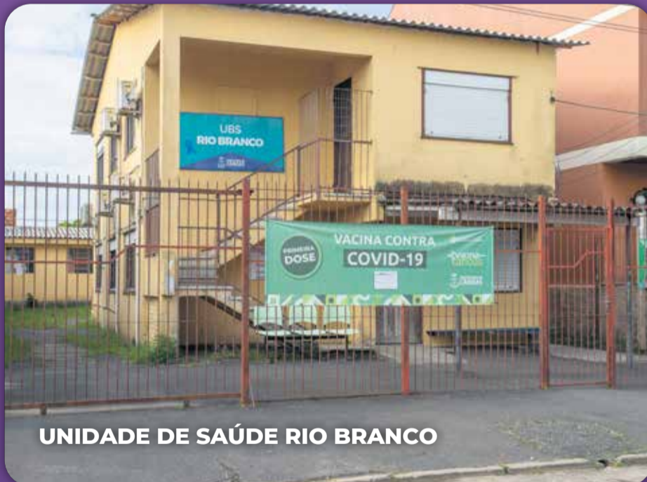
UNIDADE DE SAÚDE RIO BRANCO