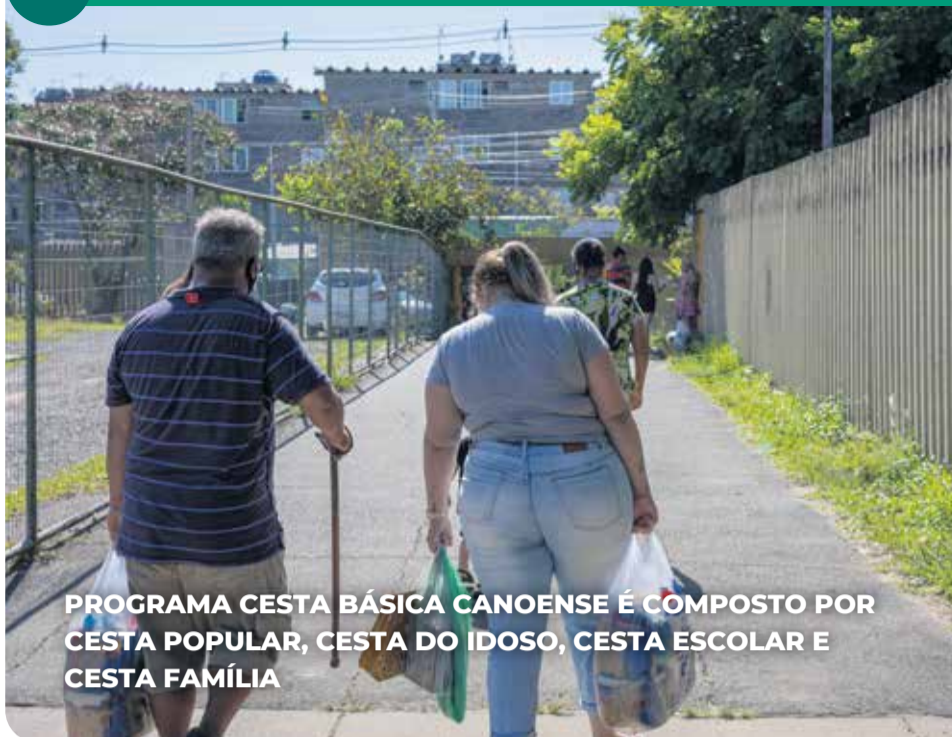
PROGRAMA CESTA BÁSICA CANOENSE É COMPOSTO POR CESTA POPULAR, CESTA DO IDOSO, CESTA ESCOLAR E CESTA FAMÍLIA