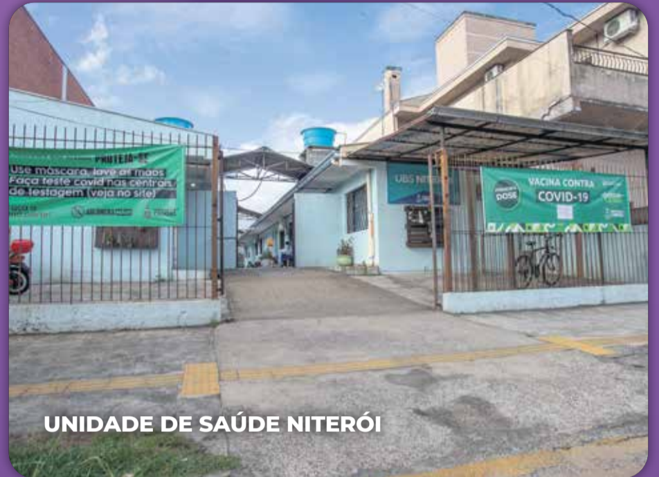
UNIDADE DE SAÚDE NITERÓI

Para casos não Covid, a Secretaria Municipal da Saúde orienta aos pacientes procurarem a UPA Liberty Dick Conter, conhecida como UPA Caçapava (Rua Caçapava, 201, Bairro Mathias Velho). O serviço funciona 24 horas. A UPA do Idoso (Rua José de Alencar, s/nº, no Bairro Rio Branco) também é referência para atendimentos não Covid de idosos com mais de 60 anos.