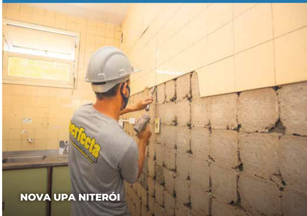
NOVA UPA NITERÓI

A antiga estrutura da Santa Isabel funcionava na Rua Cel. Vicente, em um espaço pequeno e antigo. O local era precário e inadequado aos colaboradores, dificultando o atendimento para a população. O novo posto passa a contar ainda com recepção, sala de espera, sala de triagem, oito consultórios médicos, três consultórios odontológicos, sala de reuniões, vestiários, cozinha e banheiros.