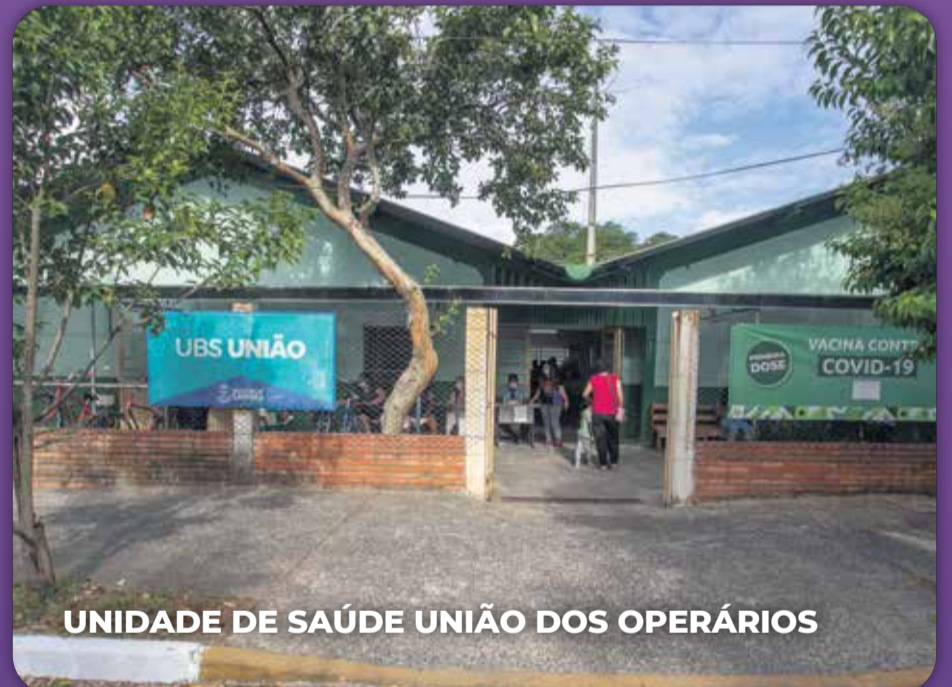
UNIDADE DE SAÚDE UNIÃO DOS OPERÁRIOS