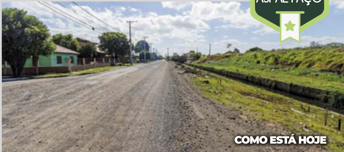
COMO ESTÁ HOJE