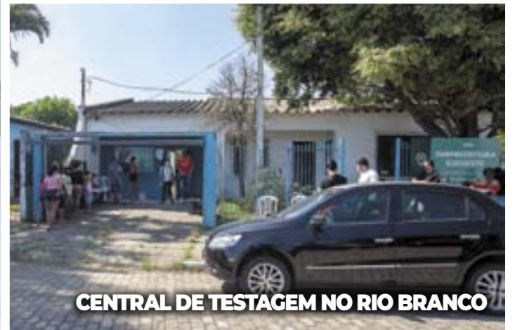
CENTRAL DE TESTAGEM NO RIO BRANCO