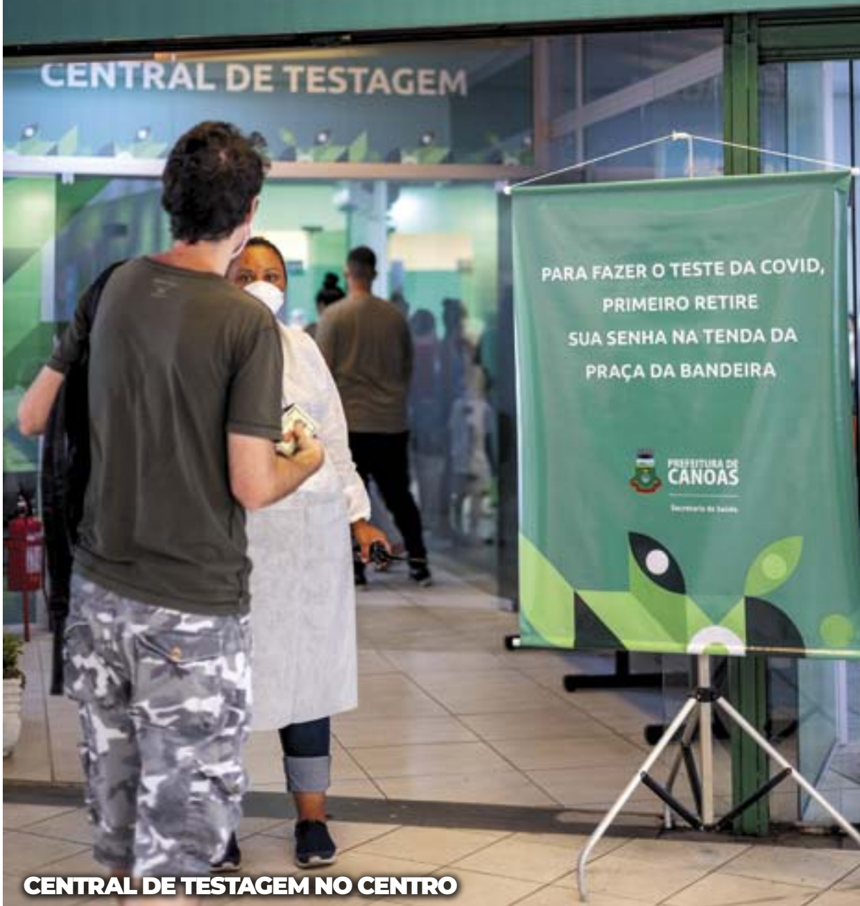
CENTRAL DE TESTAGEM NO CENTRO