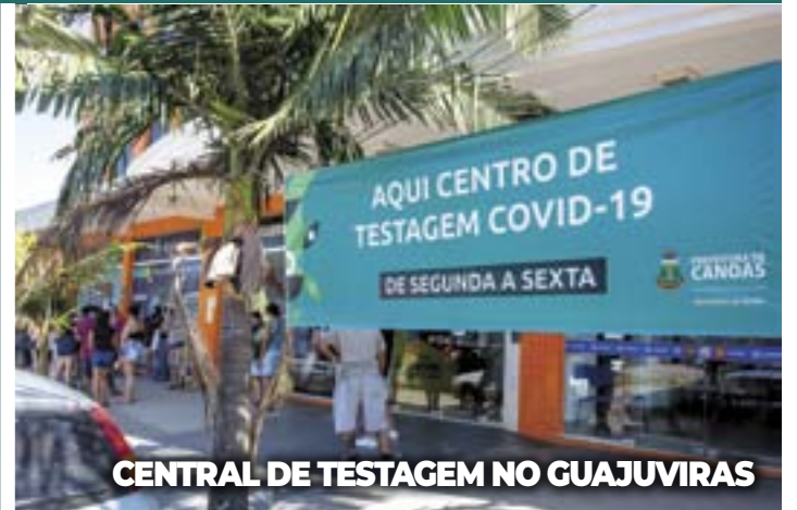
CENTRAL DE TESTAGEM NO GUAJUVIRAS