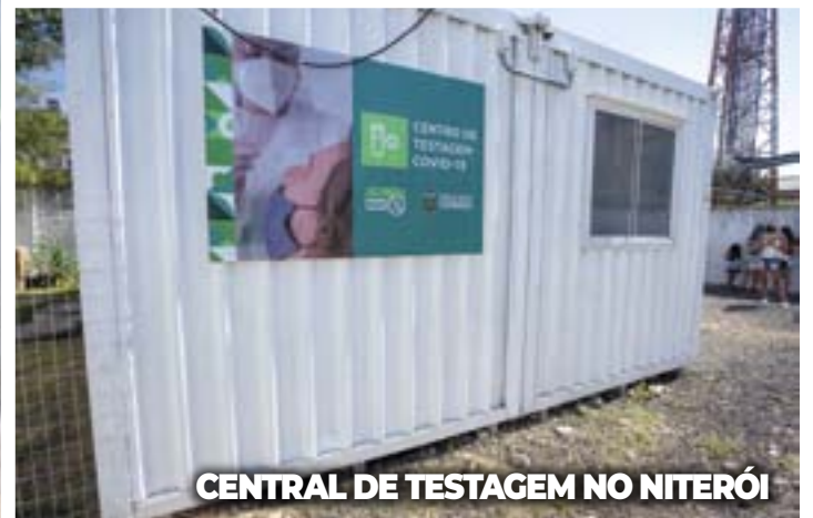
CENTRAL DE TESTAGEM NO NITERÓI