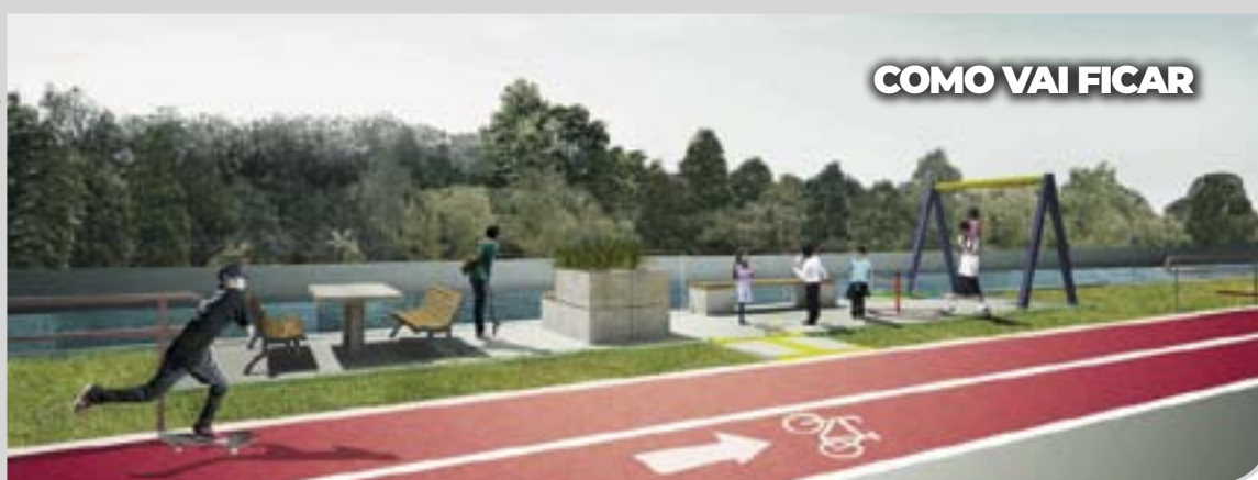
COMO VAI FICAR