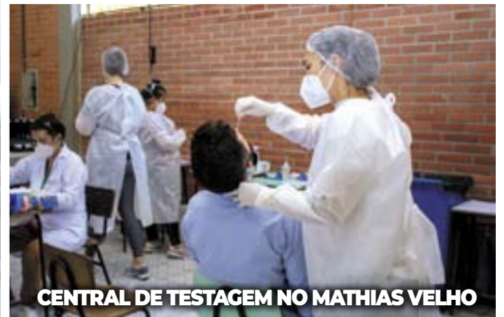
CENTRAL DE TESTAGEM NO MATHIAS VELHO