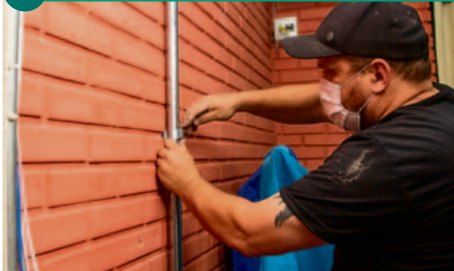
EMEF RIO GRANDE DO SUL