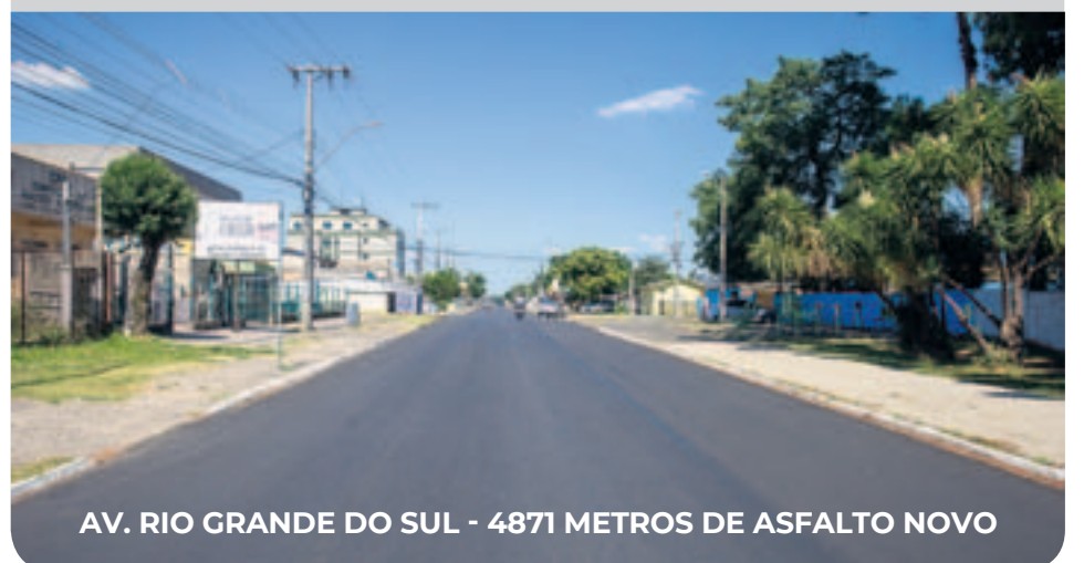
AV. RIO GRANDE DO SUL - 4871 METROS DE ASFALTO NOVO