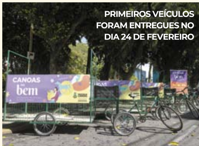
PRIMEIROS VEÍCULOS FORAM ENTREGUES NO DIA 24 DE FEVEREIRO

Até o final desta semana, a Secretaria Especial de Bem-Estar Animal (Sebea) pretende entregar outros 40 triciclos do Canoas do Bem, que prevê o fim definitivo das carroças na cidade. O programa é desenvolvido em conjunto com as secretarias da Cidadania e do Meio Ambiente.