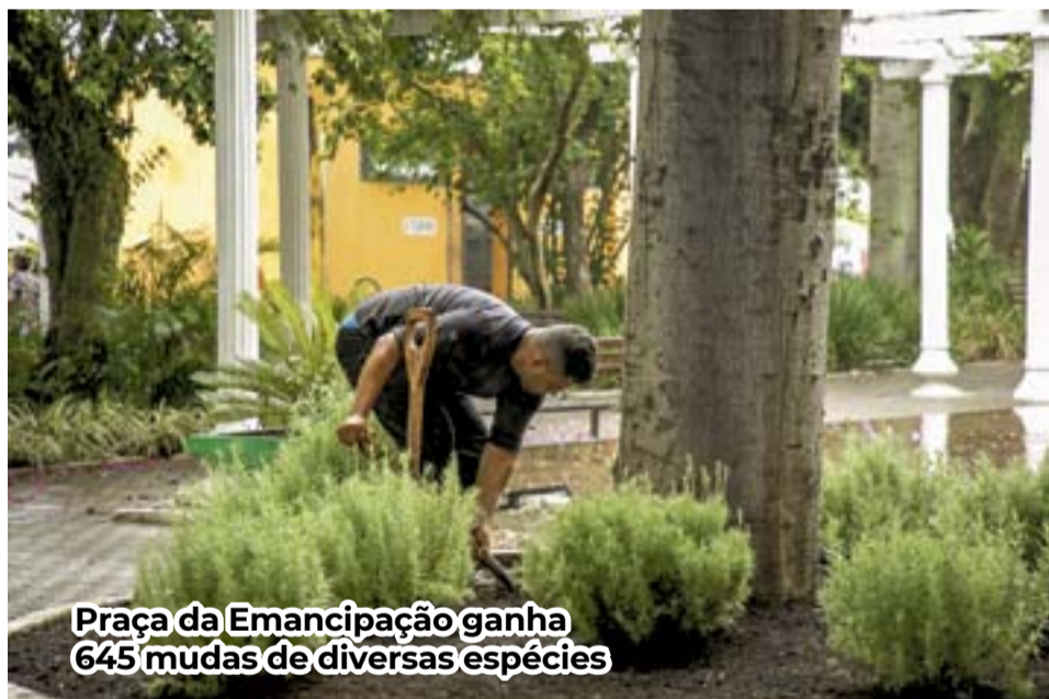
Praça da Emancipação ganha 645 mudas de diversas espécies