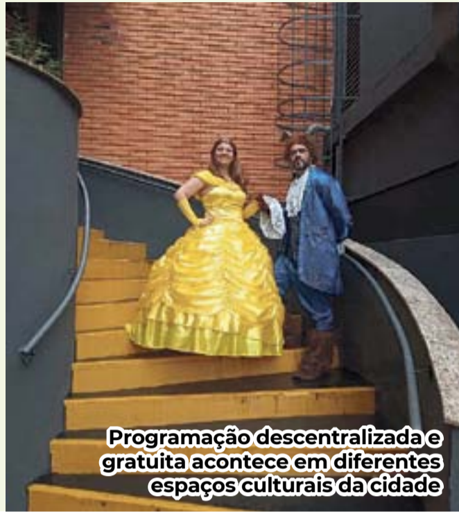
Programação descentralizada e gratuita acontece em diferentes espaços culturais da cidade

As atrações, programadas para acontecer em vários bairros, têm entrada gratuita . As apresentações são de artistas contemplados pelo Bolsa Canoas Cultural 2021 , que ofereceu 50 bolsas, de R$ 2 mil cada, em apoio aos artistas que sofreram com o impacto da pandemia.