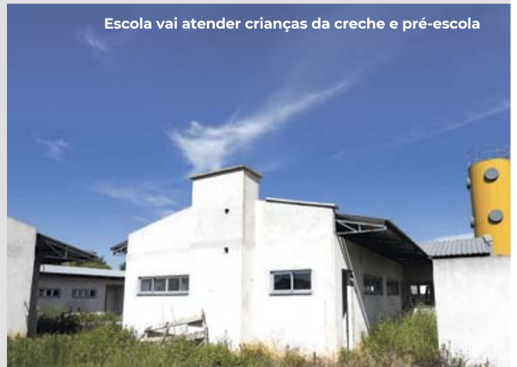
Escola vai atender crianças da creche e pré-escola