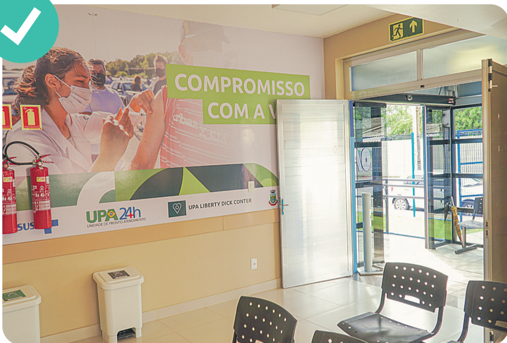
Inauguração da UPA Liberty Dick Center, no bairro Mathias Velho