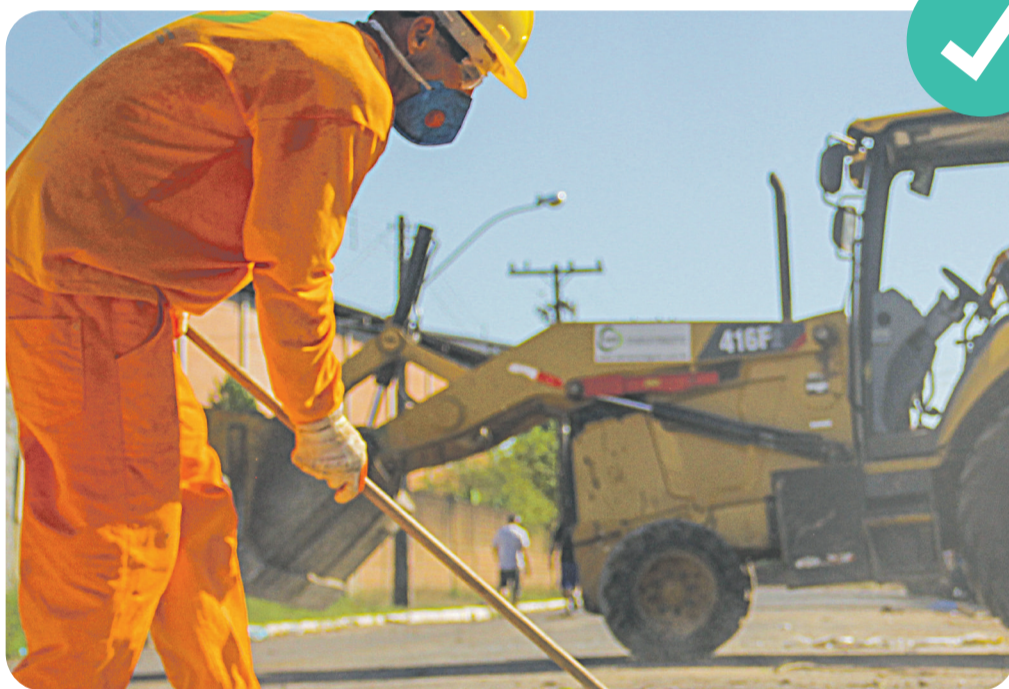
Choque de Limpeza