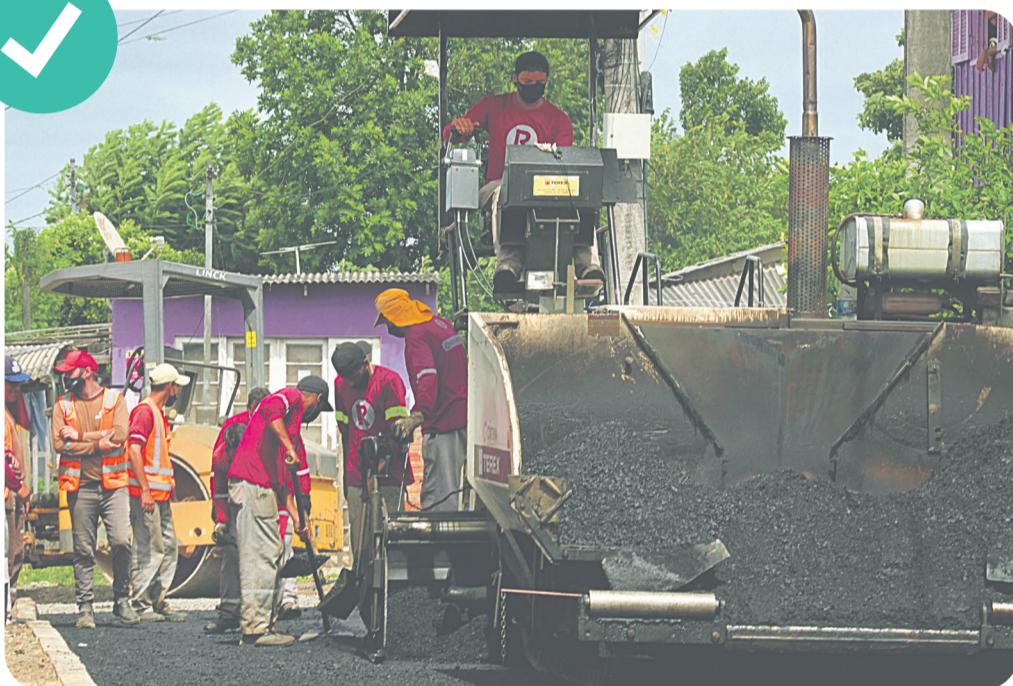
Pavimentação no Guajuviras