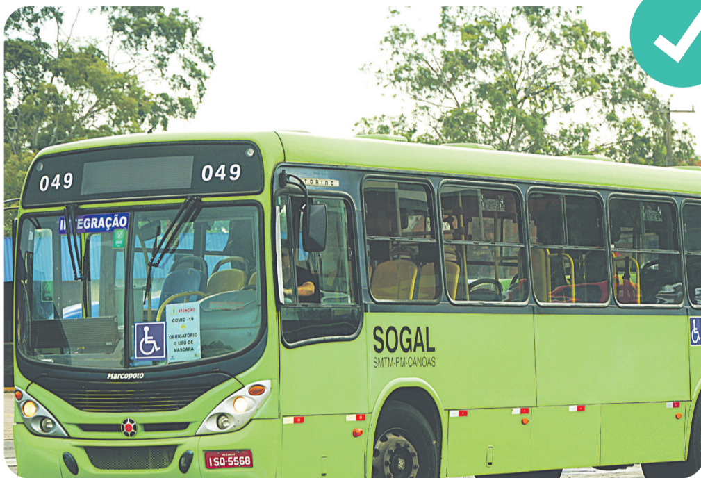
Segunda passagem gratuita