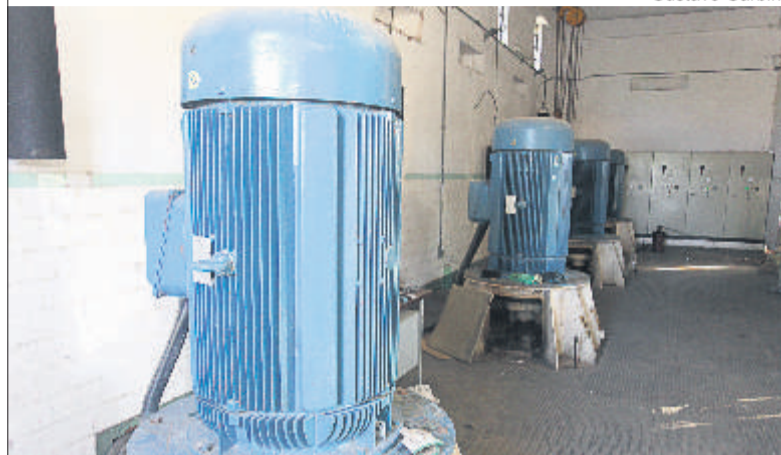
Cada motor suga 9 milhões de litros de água por hora

Desde que foi acionado o sistema de bombeamento do município, à meia-noite de quarta-feira (3), somente no período entre 5h às 17h de quinta-feira (4), foram retiradas das ruas da cidade 2,26 bilhões de litros de água, lançadas nos rios Gravataí e dos Sinos.