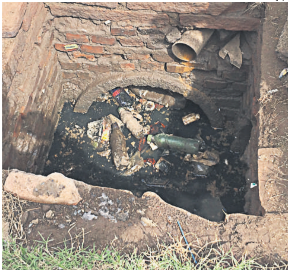
DETRITOS ENTOPEM OS CANOS E PODEM IMPEDIR ESCOAMENTO DA ÁGUA DA CHUVA