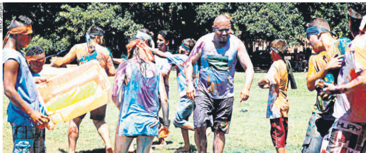
ATIVIDADES AO AR LIVRE, COMO BANHO DE TINTA, e CUIDADOS COM ANIMAIS ENVOLVERAM CRIANÇAS e ADOLESCENTES