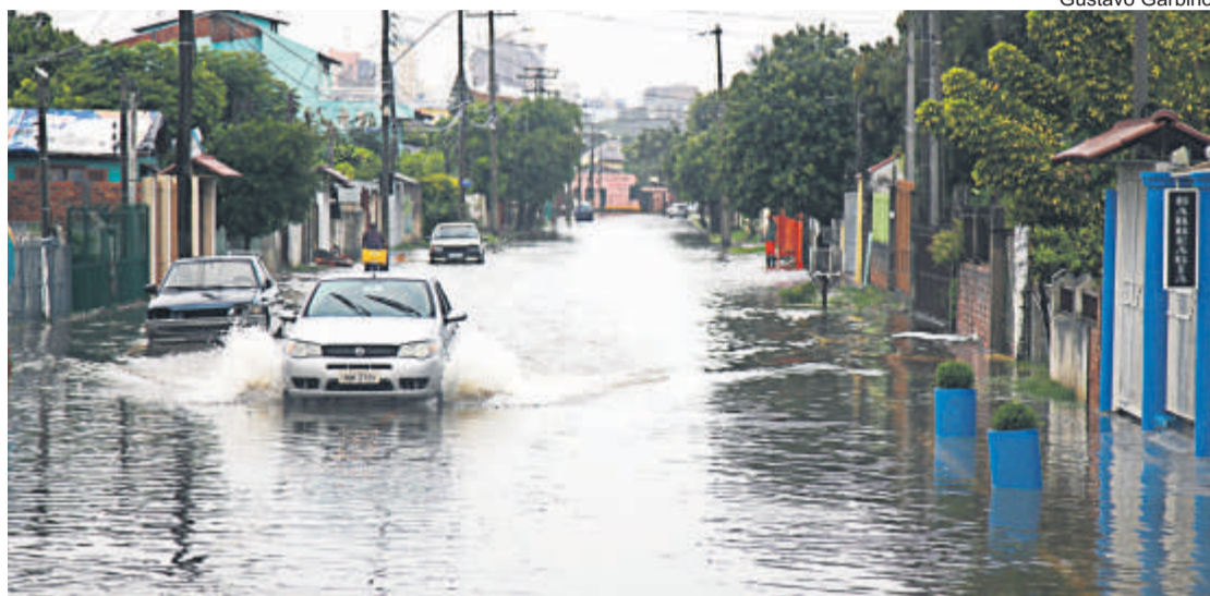
Vazão da água foi insuficiente, alagando ruas e residências em vários bairros

No período entre 30 de janeiro e 4 de fevereiro, Canoas foi impactada com um volume histórico acumulado de chuva. Foram 244 milímetros, quantidade superior à prevista para os meses de janeiro e fevereiro inteiros, conforme dados da Metsul. Somente na quinta-feira (4), foram 119mm em 24 horas.