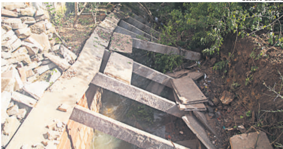
NITERÓI: PEDRAS E BASALTO JOGADOS POR EMPRESA CAUSARAM DESABAMENTO DA GALERIA

A lém do excesso de chuva, situações de descuido, como acúmulo de lixo nas ruas e nas valas contribuem para agravar os alagamentos. Isso porque os resíduos impedem o fluxo da água e podem comprometer o sistema de bombeamento da cidade. Um dos casos mais ilustrativos