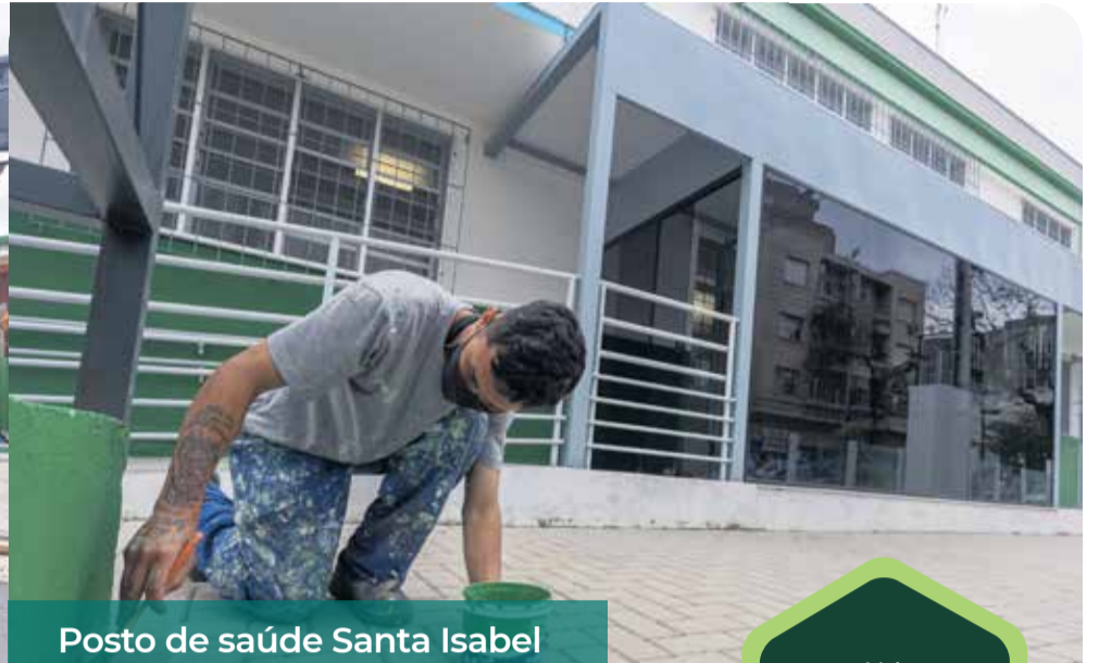
Posto de saúde Santa Isabel

As duas obras devem ser concluídas ainda no mês de outubro.