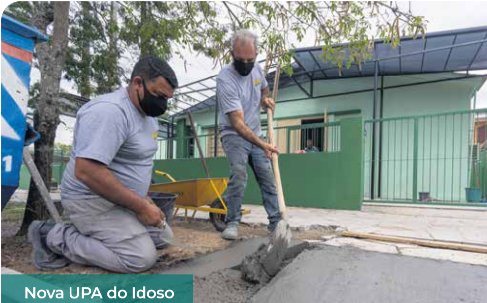
Nova UPA do Idoso