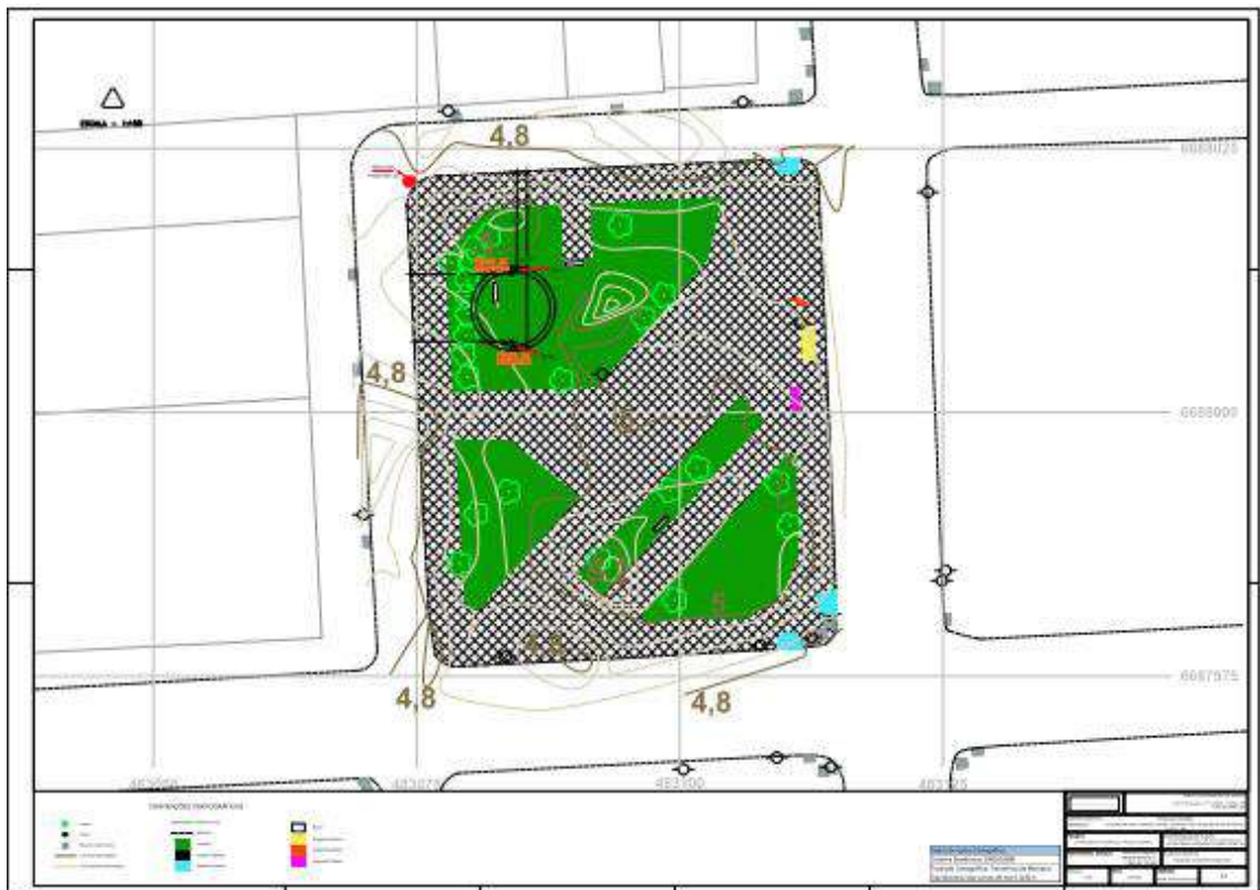
Figura 25 - Página 6 - Relatório de sondagem