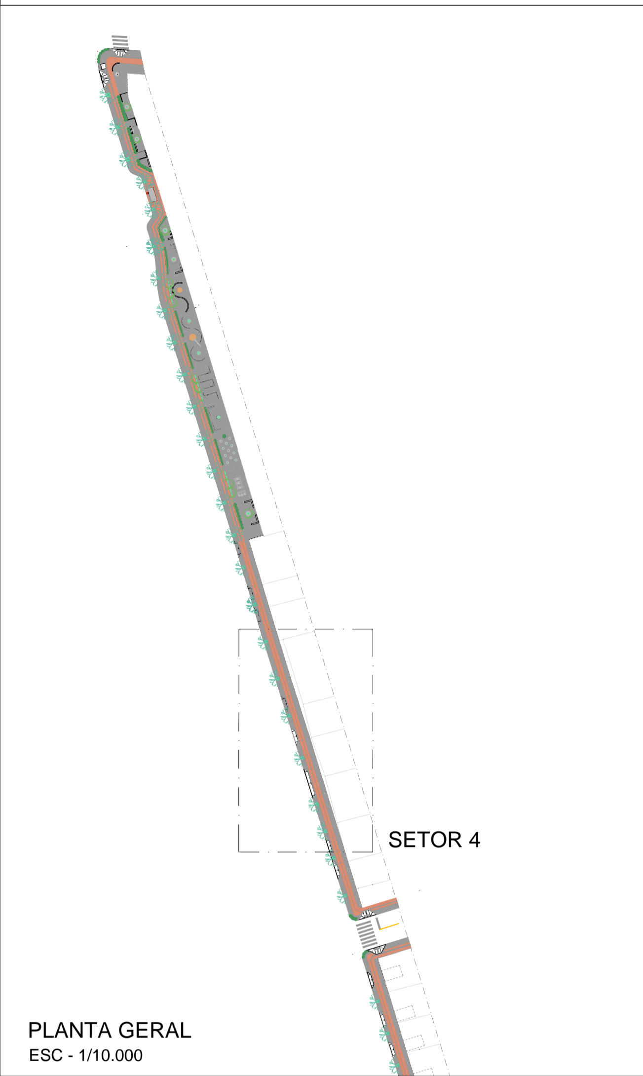
PLANTA GERAL ESC - 1/10.000