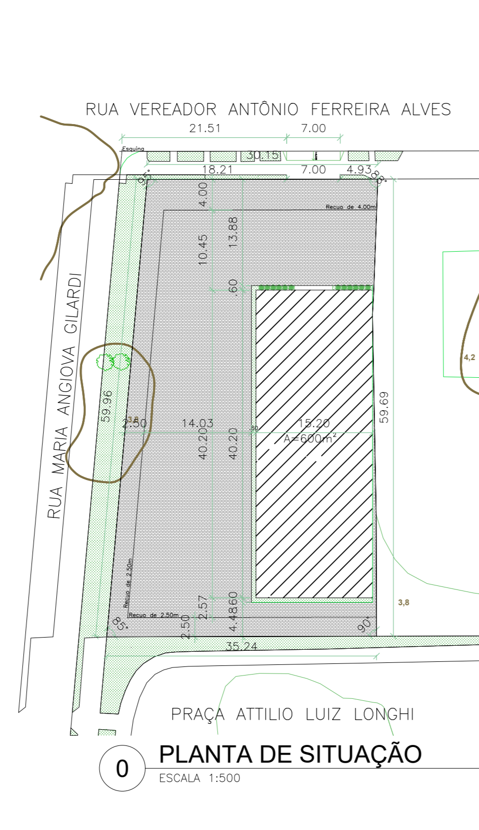
0 PLANTA DE SITUAÇÃO ESCALA 1:500